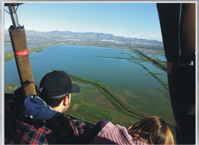
Parque Natural del Hondo